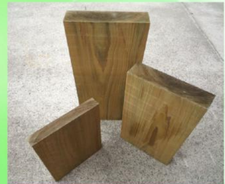
木利のふた（各種サイズあります）