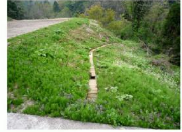
今山田集落 水路幅200mm×板厚30mm