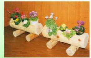
フラワーボックス