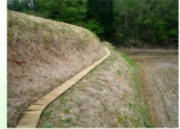
清水集落 水路幅300mm×板厚50mm